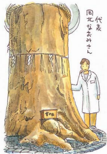
代表 岡北はみよし